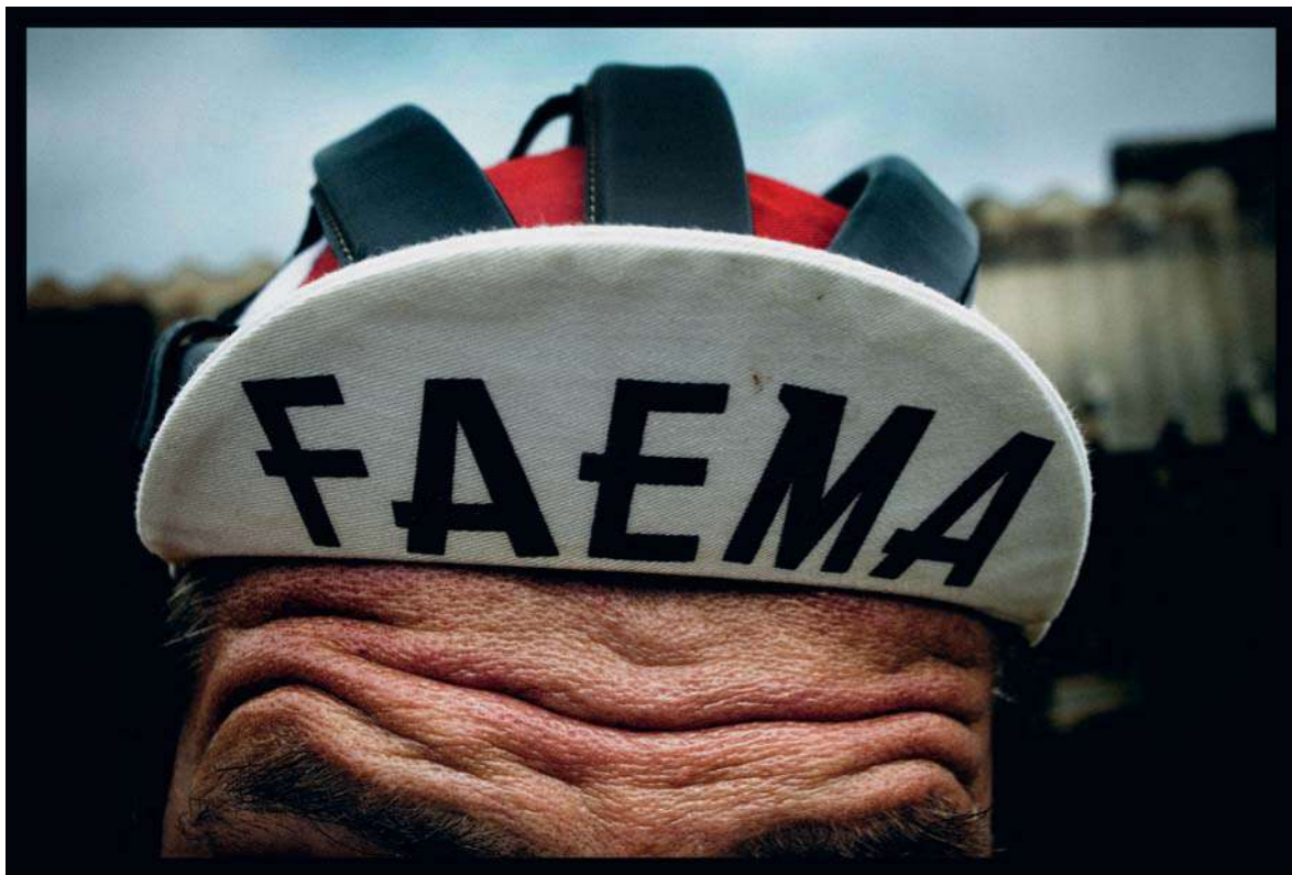
'Als Eddy met een Colnagofiets reed, dan wilden wij ook een Colnago. Als Eddy zijn pet scheef zette, dat zetten wij onze pet ook scheef.'

vijftiende zag ik Merckx winnen. Dat maakte zó'n grote indruk. Ik wilde hem zijn. En dus begon ik hem na te spelen.'