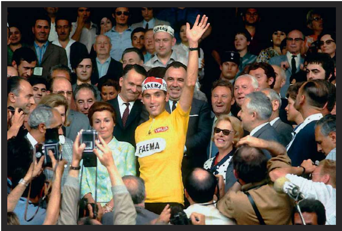
Op een dag stond koning Boudewijn voor de deur, helemaal alleen. Hij had een klein fotoetstel bij zich en vroeg of hij een selfie mocht nemen.