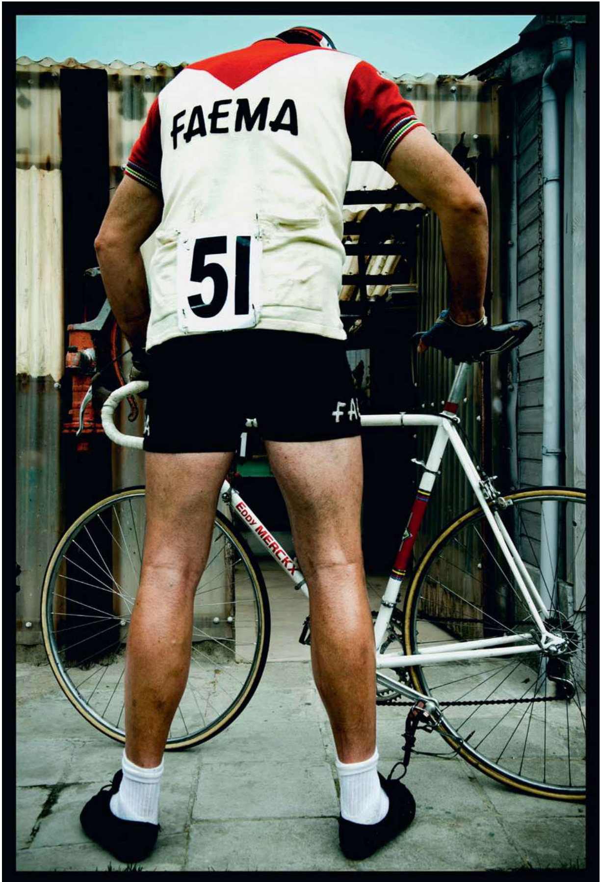
De verloren fiets van '69 is het ultieme fanobject. Tenzij iemand thuis de raket heeft staan waarmee Neil Armstrong die 21 e juli 1969 op de maan geland is.